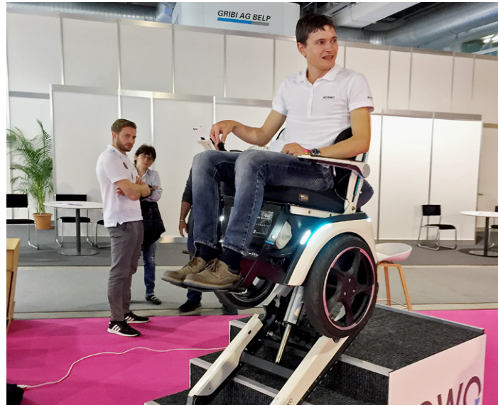
Le jury a récompensé le fauteuil roulant de Scewo, capable de monter les escaliers.

Sous le thème «Envisager l'avenir en toute sécurité», le forum de l'IFAS a été l'un des points phares du salon. Dans le cadre d'exposés et de tables rondes, des experts ont abordé des thématiques telles que l'in-