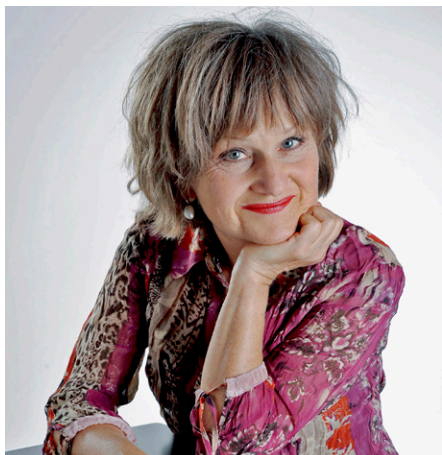
Gardi Hutter.

La clownesse Gardi Hutter répond aux «5 questions» du Magazine Aide et Soins à Domicile. Elle se demande par exemple pourquoi sa profession attire si peu de femmes et nous révèle avec qui elle apprécierait de dîner en tête-à-tête.