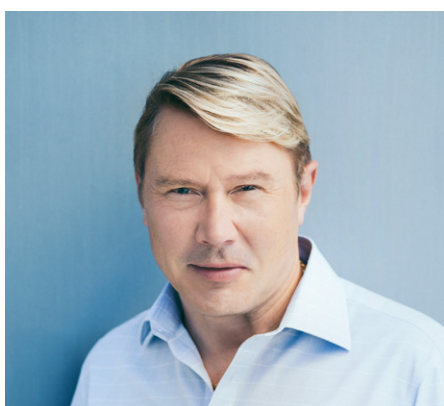
Le champion de Formule 1 Mika Häkkinen porte des appareils auditifs de Neuroth

Une perte auditive s'installe le plus souvent de manière insidieuse. Il est donc très important de se faire aider à temps. Et cela, la légende de la Formule 1 Mika Häkkinen le sait aussi: il porte lui-même des appareils auditifs et fait confiance au savoir-faire de Neuroth. En tant qu'ambassadeur de l'audition, il veut également donner du courage aux autres personnes qui souffrent d'une perte auditive.