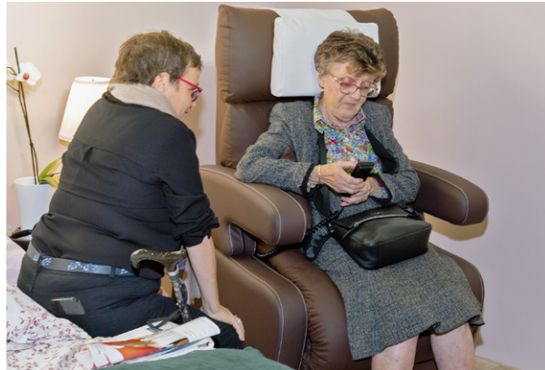
Les patients seront amenés à s'impliquer dans leur prise en charge via des applications mobiles.

Près de 32 000 visiteurs se sont rendus à la troisième édition du salon suisse dédié à la santé, selon un communiqué. La manifestation accueillait, du 4 au 7 octobre, plus de nonante exposants entre les murs de Palexpo, à Genève. A travers des expériences interactives en tous genres, le public a eu la possibilité de se mettre dans la peau d'un cardiologue, d'un médecin légiste ou d'un chirurgien. Tout un chacun a aussi pu découvrir les enjeux de la santé personnalisée, évaluer sa sensibilité à la douleur ou encore tester son taux de glycémie, voire son risque de diabète. Près de cent conférences ainsi que de nombreux films figureraient au programme de cette édition 2018. Tout au long de la manifestation, divers thèmes touchant à la santé ont été abordés, allant de la gestion au quotidien de la maladie et des addictions, en passant par la recherche, la prévention, l'alimentation ou les nouvelles technologies. La prochaine édition de Planète Santé est déjà agendée. Elle aura lieu à Martigny (au CERM), du 14 au 17 novembre 2019.