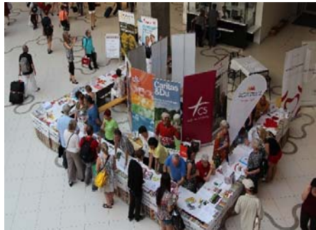
Intégration de la démence, 3ème arrondissement, Vienne